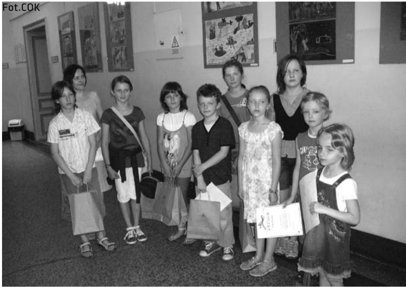
Laureaci konkursu plastycznego

W konkursie plastycznym pt. „CZY TO POŻAR, CZY TO POWÓDŹ, W KAŻDYM MIEJSCU I O KAŻDEJ PORZE DZIELNY STRAŻAK CI POMÓŻE” zorganizowanym przez COK „Dom Narodowy” oraz drukarnię i studio reklamy „Hexachrom” w Cieszynie wzięło udział 12 szkół i przedszkoli z Cieszyna i okolic. Nadesłano ponad 170 prac, z których jury wyłoniło najlepsze. Ukazą się one w kalendarzu na 2012 rok.