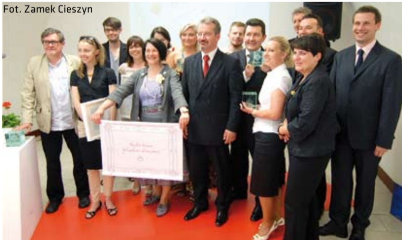
Uroczysta gala rozstrzygnięcia konkursu „Śląska Rzeczą” odbyła się 3 czerwca