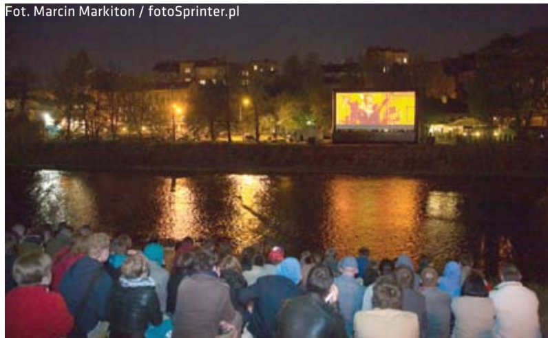
Kinomaniacy mieli możliwość oglądania filmów pod gołym niebem