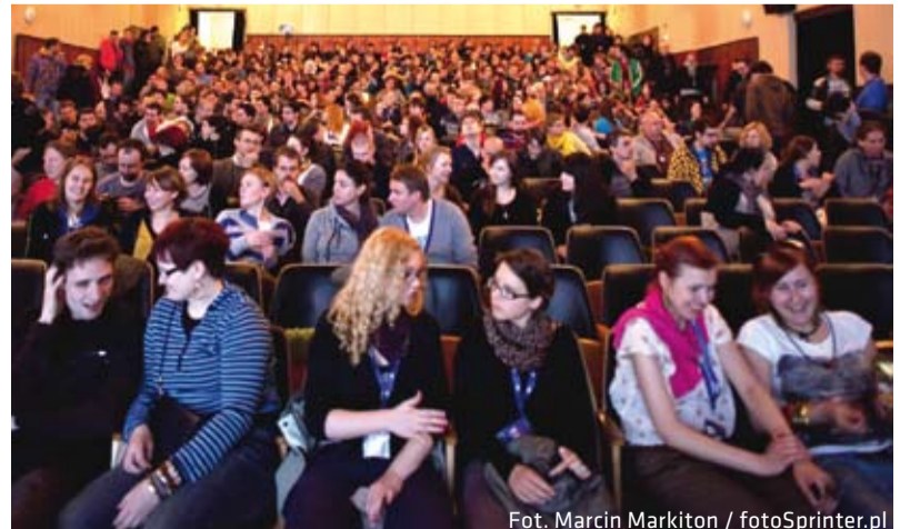
Festiwalowe projekcje gromadziły tłumy widzów