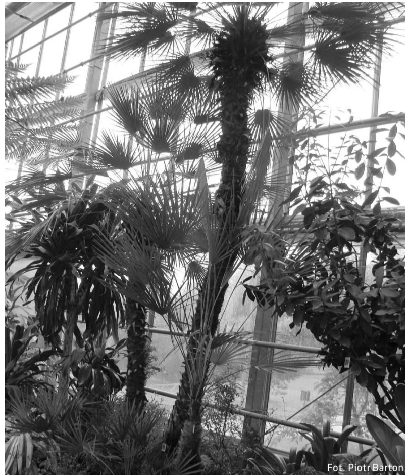
W palmiarni... (Nowy Dwór)