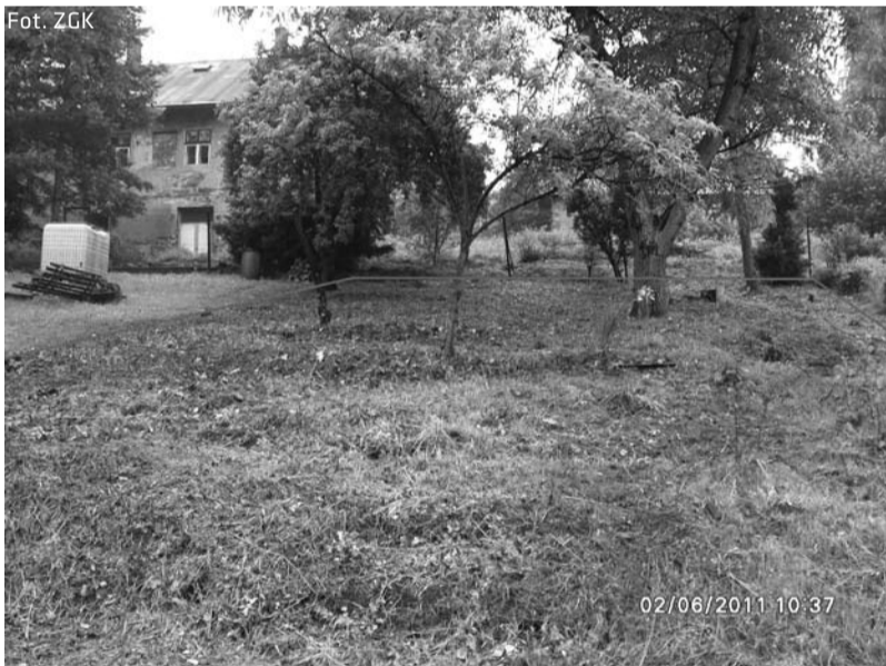
Działka przy ul. Mickiewicza przeznaczona do dzierżawy

Bliższych informacji w tej sprawie można zasięgnąć pod numerem telefonu 33 4794 230 lub 33 4794 278.