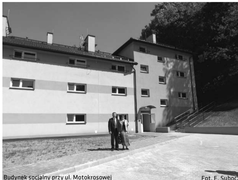
Budynek socjalny przy ul. Motokrosowej