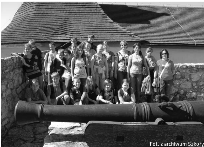
Grupa uczestników wyjazdu do Rožňavy