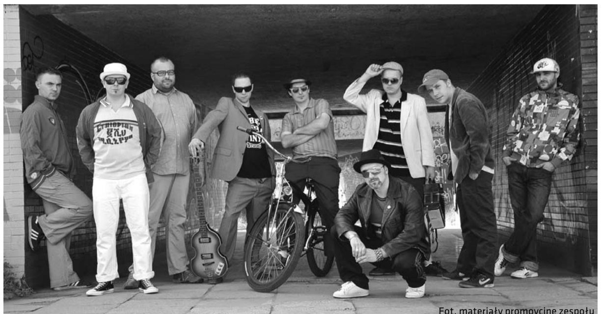
Zespół Vavamuffin, w Cieszynie wystąpią 16 lipca

Zapowiada się duża różnorodność w sztukach wizualnych, czy