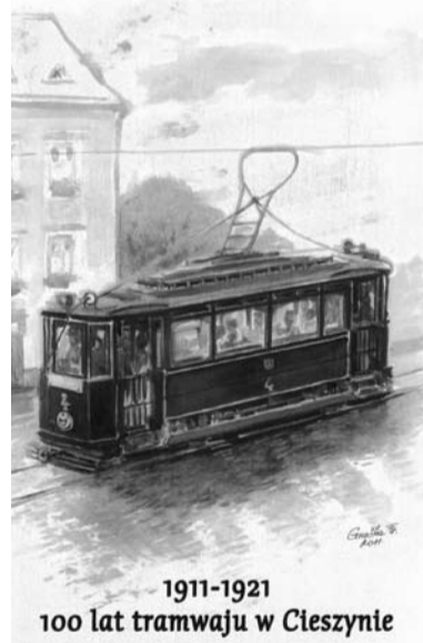
1911-1921 100 lat tramwaju w Cieszynie