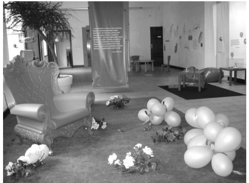
Bajkowy tron zaprasza...

Mam nadzieję, że nasza wystawa poprzez magiczne, bajkowe nawiązania, zmieni to nastawienie. Przecież projektanci, niczym bajkowi czarodzieje, sprawiają, że nasz świat jest trochę bardziej kolorowy. Z drugiej strony chcemy pokazać, że projektanci nie żyją gdzieś tam daleko, ale działają tuż obok. Stąd na naszej wystawie